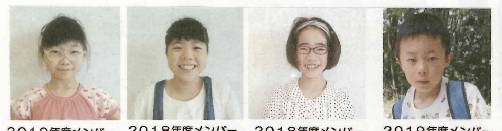
2019年度メンバー 2018年度メンバー 2018年度メンバー 2019年度メンバー

【無言館】長野県上田市にある戦没画学生慰霊美術館。第2次世界大戦などに出征し、帰らぬ人となった東京美術学校(今の東京芸大)や帝国美術学校(武蔵野美術大学、多摩美術大学の前身)などで学んでいた画学生、他に独学で絵を学んでいた若者たちが遺した作品、遺品、戦地からの手紙などを保存し、展示している。1997年開館。