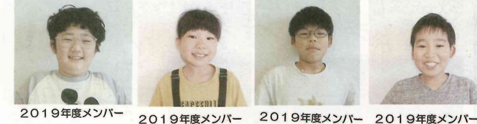
2019年度メンバー 2019年度メンバー 2019年度メンバー 2019年度メンバー