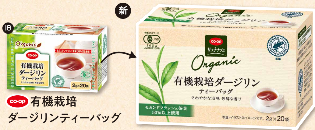
CO-OP 有機栽培 ダージリンティーバッグ