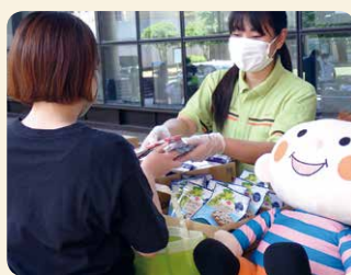
コロナ禍で不安定な生活を送る大学生にも食料品を提供しました

賞味期限がお届け基準以内の商品は、次週以降の企画やインターネット注文「eフレンドズ」での数量限定企画で活用したほか、お店での販売など、できるだけ食品ロスにならないよう努めました。また各地域のフードバンクなど32団体に寄贈しました。