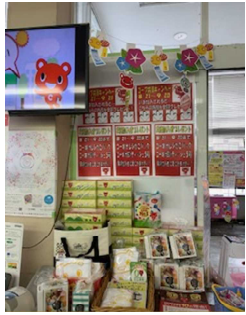
東久方店 共済コーナー