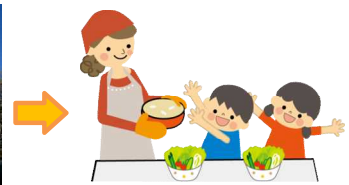
必要とされている方々