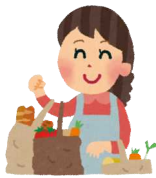
コープぐんま組合員