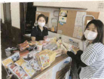
フードバンクまえばし お届けの様子

昭和店サービスカウンターにて、 随時受け付けしています。 常温保存可能な食品で、 賞味期限2ヶ月以上のもの。 ご協力お願いたします。