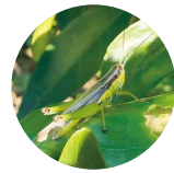
有機栽培の園地では、イナゴやバッタ、トンボなどたくさんいます

化学的に合成された肥料や農薬の使用を避けることを基本として、自然界の力を生かした生産者が受ける認証。このマークがないものは「有機」「オーガニック」と表示できません。