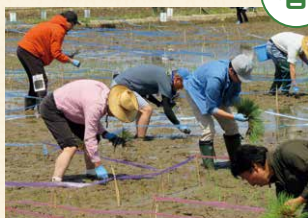
田んぼに異なる品種の苗を植えて絵を描く「田んぼアート」の田植えを行いました