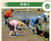
田んぼに異なる品種の苗を植えて絵を描く「田んぼアート」の田植えを行いました

プロジェクトでは、地元生協のコープデリにいがたを中心に組合員・職員が毎年佐渡を訪問。JA佐渡の生産者や地元の皆さんと交流し、見て・聞いて・体験することで、より多くの方にプロジェクトへの理解が広がることを目指しています。