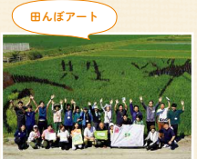
今年の田んぼアートのテーマは「共生」。順調に稲穂が実り、きれいな絵がくっきりと浮かび上がりました