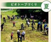
田んぼの周辺を耕し、トキのエサ場となるビオトープを作りました