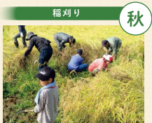
鎌を初めて手に取る組合員の皆さんも、生産者さんからコツを教わってもらい、サクサクと刈っていました

コープデリグループは、事業と活動を通して「SDGs(持続可能な開発目標)」の達成を目指しています。