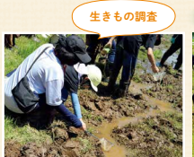
田んぼやビオトープにすむ生きものを調べ、生きもの多様性やトキと暮らす環境づくりを学びました