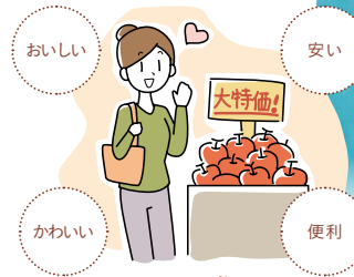
日常のお買い物に「新しい視点」をプラス！

安く、便利な商品をもっとたくさん使いたい……。でもその商品を作るために、魚の乱獲や森林の伐採、開発途上国での劣悪な労働環境など、さまざまな問題が引き起こされている場合があります。商品が私たちに届くまでには長い道のりがあり、手にした商品がどのように作られたのか、私たちに分かりにくいことが多いからです。だからこそ、毎日のお買い物でできることがあります。いつもの「商品の選び方」に、「どこで、誰が作っているか」「どのようにつくられたか」といった視点をプラスして