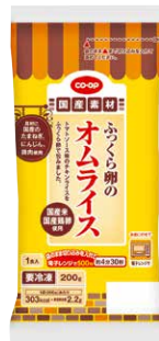
CO-OP ふっくら卵のオムライス

ふっくら焼き上げた卵シートでチキンライスを包みました。チキンライスは国産のたまねぎ、鶏肉、にんじんの具材入りです。