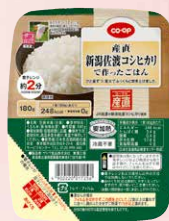
CO-OP 産直 新潟佐渡 コシヒカリで作ったごはん 1個