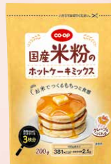
CO-OP 国産米粉の ホットケーキミックス 1個