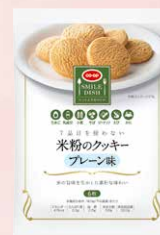
CO-OP 7品目を使わない 米粉のクッキー プレーン味 1個

※「ワン・モア・ライス」やってみた宣言」や「ワン・モア・ライス」アイデア」は何回でも投稿していただけますが、プレゼントの応募は期間中1人1口とさせていただきます。なお、プレゼント企画の対象は組合員とさせていただきます ※賞品の発送は11月中旬を予定しています。厳正な抽選により当選者を決定し、賞品の発送をもって発表にかえさせていただきます。 なお、抽選方法や当選についてのお問い合わせは受け付けておりません