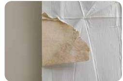
間の紙が茶色いもの