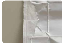
間の紙が白いもの