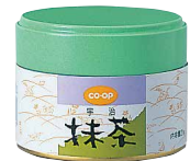
co・op 抹茶 規格20g 価格648円(税込699円)