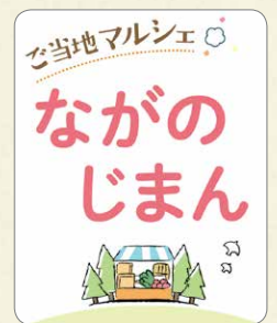
「ご当地マルシェ」ロゴ。各生協ごとに異なります

コープデリ連合会は、今後も会員生協の組合員の皆さまのくらしに貢献できるよう、 事業と活動に取り組み ます。1都7県のコープが手をとりあって、 今までできなかったことも、共同の力で実現 していきます。設立 30周年 にあわせて、今後 キャンペーン を行う予定です。お楽しみに！