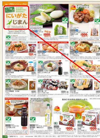
「ハピ・デリ！」誌面イメージ

共同で行う業務もある一方、各生協の歴史や地域特有の商品を大切にしています。宅配の商品カタログ『ハピ・デリ！』の「ご当地マルシェ」のコーナーは、地元で製造していたり、地域になじみのある商品を各生協ごとに紹介しています。