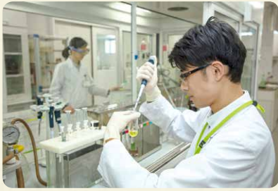
商品検査センターは、フードチェーン全体での食の安全の取り組みが機能していることを、科学的・客観的に確認しています

コープデリ連合会では独自の 商品検査センター を持ち、年間約 3万件の検査 を行っています