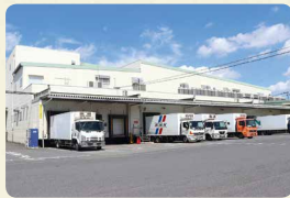
桶川要冷蔵品センター (埼玉県桶川市)。冷蔵商品などを集品・分荷し、宅配センターへ配送しています