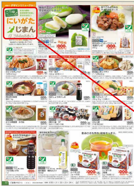
「ハビ・デリー」誌面イメージ

共同で行う業務もある一方、各生協の歴史や地域特有の商品を大切にしています。宅配の商品カタログ「ハビ・デリー」の「ご当地マルシェ」コーナーは、地元で製造したり、地域になじみのある商品を各生協ごとに紹介しています。