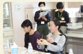
商品グループインタビュー。組合員の皆さまから、商品の改善に向けてさまざまな声を聞かせていただいています

コープデリ連合会で商品をまとめて仕入れることで、利用しやすい価格で取り扱うことや取り扱い商品数を増やすことができます。また、より多くの組合員さんの声を集め、共有することで、商品の改善やサービスの向上につなげることができま