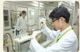
商品検査センターは、フードチェーン全体の食の安全の取り組みが機能していることを、科学的・客観的に確認しています

物流センターを各地域に配置し、効率良く集品・分荷し、宅配センターや店舗への商品配送を行っています。コープデリ連合会では独自の商品検査センターを持ち、年間約3万件の検査を行っています