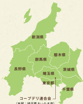
コープデリ連合会 (本部:埼玉県さいたま市)