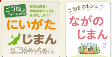
「ご当地マルシェ」ロゴ。各生協ごとに異なります