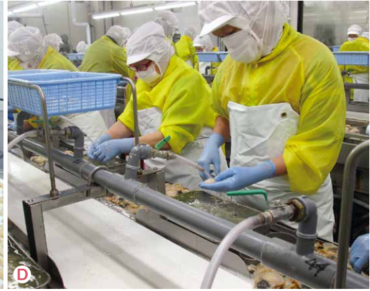
水揚げの様子(写真A)。紋別漁業協同組合は海の目の前に自営の冷凍工場を持ち、水揚げ後すぐ運び、鮮度の良い状態で加工できることが強みです(写真B)。冷凍工場での湯通しの様子(写真C)。湯通しすることで貝から身を取りやすくなり、傷を付けません。取り出したら、人の手で貝殻片、砂粒などを取り除き貝柱の状態にします(写真D)。-33度のトンネルフリーザーを通して急速冷凍します(写真E)。冷凍されたほたてを目で確認しながら、パッキングの工程に進みます(写真F)。