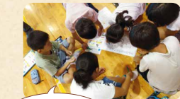
これから給食や家での食事は食べ残さないようにしたい

先進国やアフリカなどに食料を分配するゲームで世界の食料の不公平さを学びます。日本では多くの食品ロスを出しており、自分に何ができるかをグループで考えます。