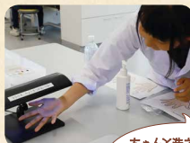
ちゃんと洗えていると思っていたのに〜エヘッ、全然ダメだ〜!

手洗いチェック 汚れに見立てた蛍光ローションを手に塗り、その後ハンドソープで普段通り手洗い。その手をブラックライトにかざすと……洗い流せなかったローションが光り、洗い残しがわかります!