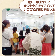
厳しい検査をして食の安全を守ってくれていることが伝わりました