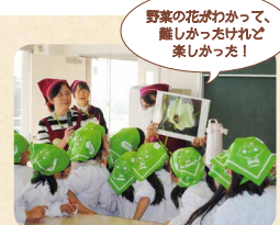
野菜の花がわかって、誰しかなかったけど楽しかった!