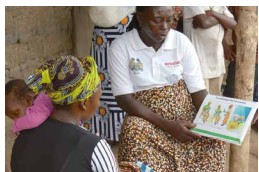
母親支援グループでは、保健センターの指導を受けた母親が講師を務めることで、知識がより広がることを目指しています。読み書きができない人も多いため、紙芝居や歌で学習します