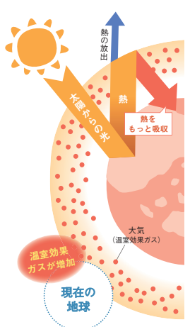
参考：全国地球温暖化