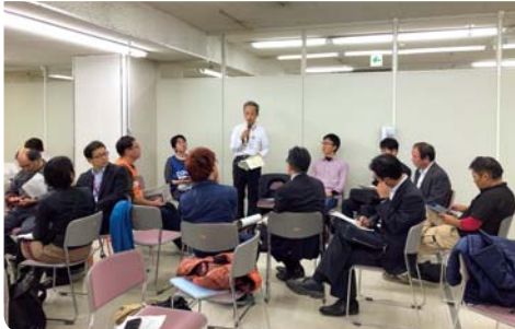
(写真上)センターから遠方の災害現場へはバスで送迎 (写真下)さまざまな団体が一緒に課題に対応するため、 会議で情報を共有