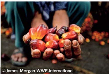
アブラヤシの実。果肉と種子それぞれから油が取れる