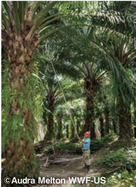
アブラヤシの木。高さは約20m、長いカマで実を切り落とすのは重労働

パーム油は、赤道直下の熱帯で栽培される「アブラヤシ」という植物の実を搾って作られます。その特徴は、生産性が高く幅広い用途に使用できること。私たちの生活に欠かせない商品に使われているため、世界中でパーム油の需要が伸び続けています。生産しているのは主にインドネシアとマレーシアで、この2カ国で世界の生産量の85%を占めています。