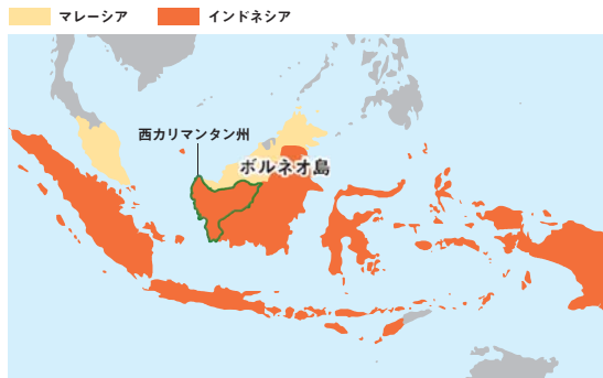
世界の生産量の85%がインドネシア・マレーシアで生産されている