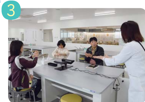
3 一人ひとり、どこを洗い残していたか確認。正しい手の洗い方を学んで再度手を洗い、今度はきれいに落ちました。