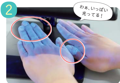
2 専用のライトを当てて確認。洗い残しの部分が白く光ります。特に爪の周り、関節のしわの部分が多く光っていました。