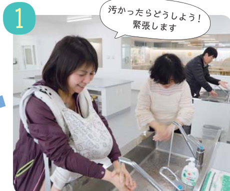
1 汚れに見立てた専用のローションを手に塗ってから、普段と同じように手を洗います。