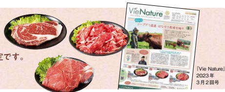
【Vie Nature】 2023年 3月2日号