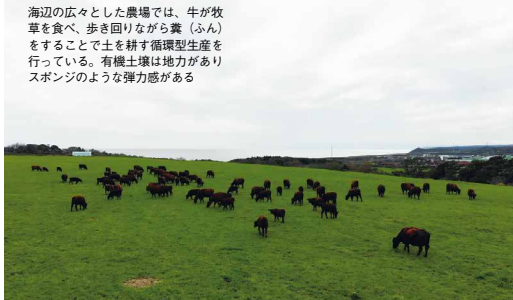
海辺の広々とした農場では、牛が牧草を食べ、歩き回りながら糞（ふん）をすることで土を耕す循環型生産を行っている。有機土壌は地力がありスポンジのような弾力感がある