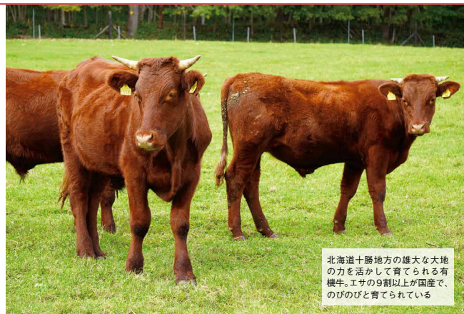
北海道十勝地方の雄大な大地の力を活かして育てられる有機牛。エサの9割以上が国産で、のびのびと育てられている

ば、生産をあきらめる人がもつと増えるでしょう。一方、人口増や紛争、気候変動で、食料を輸入し続けることは難しくなっています。国内で食料やエサを生産することはとても重要です。