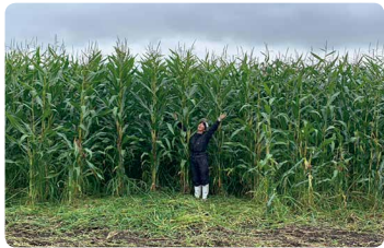
有機牛のエサとなる有機JAS認証取得トウモロコシ。秘面積11haで、牛の管理と併行して育てている

牧草だけでなく育つ日本短角種ですが、北十勝ファームでは穀物も与え、よりおいしいお肉を目指しています。近隣の耕作放棄地を借り、自ら農地を耕してエサとなる作物を育てることで、地元十勝産とあわせ90%以上が国産と高水準の自給率を達成。輸送距離が短く、トータルで排出するCO 2 が少なくなる、エコな畜産業を実践しています。