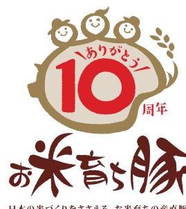
日本の米づくりをささげる、お米育ちの産直豚。

大豆のドライパックのパウチタイプを購入することが多いです。自分が購入しているものが、どのように作られたのか知ることができ、興味深かったです。(富岡市:けいママ)