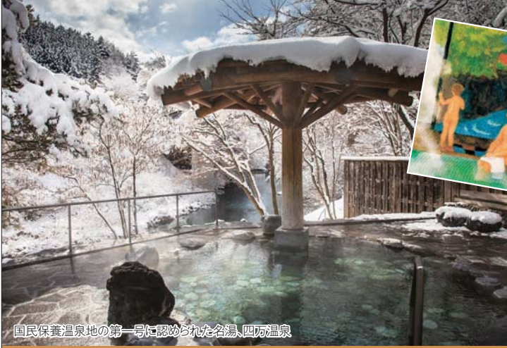
国民保養温泉地の第一号に認められた名湯、四万温泉