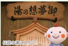
伝説の湯に入ろう!